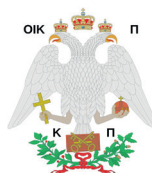
Griechisch-orthodoxe Kirche in der Schweiz Église orthodoxe grecque en Suisse