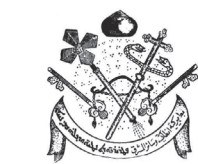
Syrisch-orthodoxe Kirche in der Schweiz Église orthodoxe syriaque en Suisse